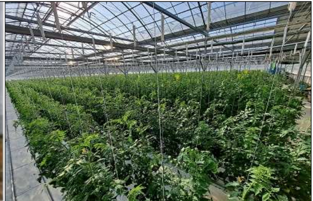
◆ 내재해형 하우스시설 ◆