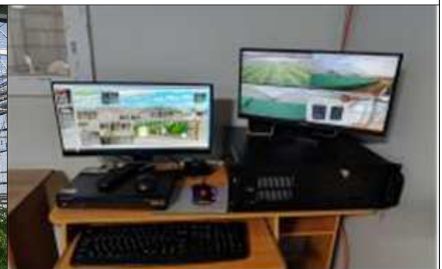
◆ IT활용 환경제어시스템 및 ICT 융복합 확산 지원 ◆